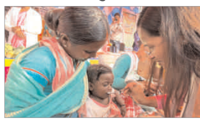
प्रोडम फाइटर संवाददाता बेड़ो : प्रखंड के टेरो पंचायत में बुधवार को आपके अधिकार आपकी सरकार आपके द्वार कार्यक्रम का सारा गांव विकसित हो सके। मौके पर बीडीओ सह सीओ आयोजन किया गया। कार्यक्रम में विधायक शिल्पी नेहा तिकी सभी स्टॉलों का निरीक्षण किया और सरकारी अधिकारियों से योजना की जानकारी लिया। मौके पर कई लाभुको को स्वीकृति प्रमाण पत्र का वितरण किया। वहीं योजनाओं

का आवेदन जमा करने के लिए अलग अलग स्टॉल लगाया गया। जहां कई आवेदन का तत्काल निष्पादन किया गया। मौके पर विधायक ने जन कल्याणकारी योजनाओं के बारे में जानकारी दिया। विधायक ने कहा कि जन-जन तक विकास कार्य का लाभ पहुंचना चाहिए ताकि प्रखंड का सारा गांव विकसित हो सके। कार्यक्रम में विधायक शिल्पी नेहा तिकी सभी स्टॉलों का निरीक्षण किया और सरकारी अधिकारियों से योजना की जानकारी लिया। मौके पर कई लाभुको को स्वीकृति प्रमाण पत्र का वितरण किया। वहीं योजनाओं