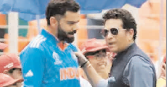
हो गए हैं। लेकिन उन्हें 2027 में होने वाले वनडे वर्ल्ड कप में खेलना चाहिए। सचिन तेंदुलकर ने कोहली के 50वें शतक के बाद बड़ी बात कही है। जाहिर है कि पूर्व भारतीय कप्तान कोहली वनडे क्रिकेट में 50 शतक लगाने वाले

एजेंसी नयी दिल्ली : विराट कोहली के खेल को देखते हुए उन्हें 2027 का वर्ल्ड कप भी खेलना चाहिए। पूर्व भारतीय दिग्गज सचिन तेंदुलकर ने कुछ इसी तरह के संकेत दिए हैं। उनका कहना है कि विराट ने वर्ल्ड कप 2023 में कमाल का प्रदर्शन किया। उन्होंने 3 शतक के दम पर 700 से अधिक रन बनाए और प्लेयर ऑफ द टूर्नामेंट भी बने। वे वर्ल्ड कप के एक सीजन में 700 या उससे अधिक रन बनाने वाले पहले खिलाड़ी हैं। हालांकि वर्ल्ड कप के फाइनल में टीम इंडिया को ऑस्ट्रेलिया से 6 विकेट से हार मिली। कोहली भले ही 35 साल के